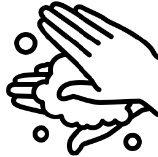
Waschen Sie Ihre Hände nach dem Husten oder Niesen