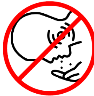
Mund und Nase beim Husten oder Niesen Abdecken. Beachten Sie die Hust- und Niesetikette