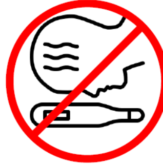
Gehen Sie bei grippeähnlichen Symptomen zum Arzt