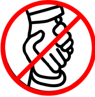
Verzichten Sie auf Umarmungen und Händeschütteln